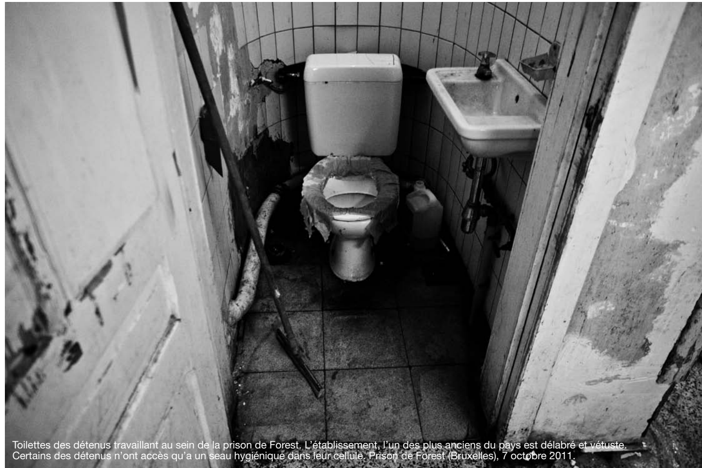
Toilettes des détenus travaillant au sein de la prison de Forest. L'établissement, l'un des plus anciens du pays est délabré et vétuste. Certains des détenus n'ont accès qu'à un seau hygiénique dans leur cellule. Prison de Forest (Bruxelles), 7 octobre 2011.