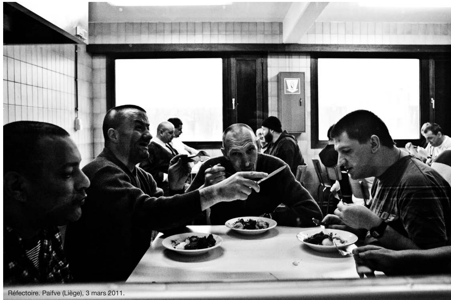
Réfectoire. Paifve (Liège), 3 mars 2011.