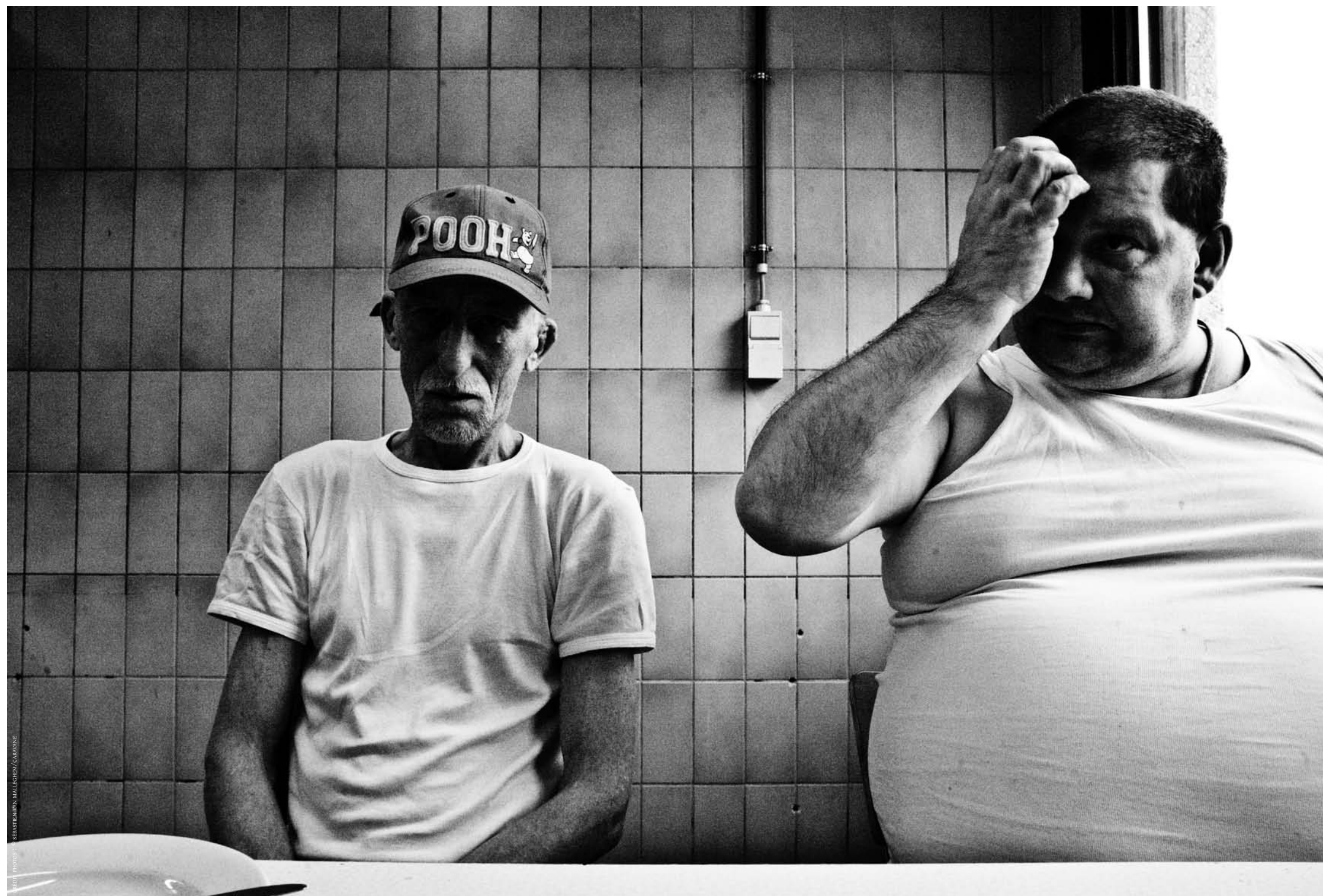
Deux internés mangent ensemble au réfectoire. Le centre de défense sociale de Paifve, récent (1972), accueille des "patients", reconnus irresponsables de leurs actes et enfermés dans des "chambres". Paifve (Liège), 31 mars 2011.

A lire Un ouvrage sur la série Police sera publié à la rentrée prochaine aux éditions Yellow Now.