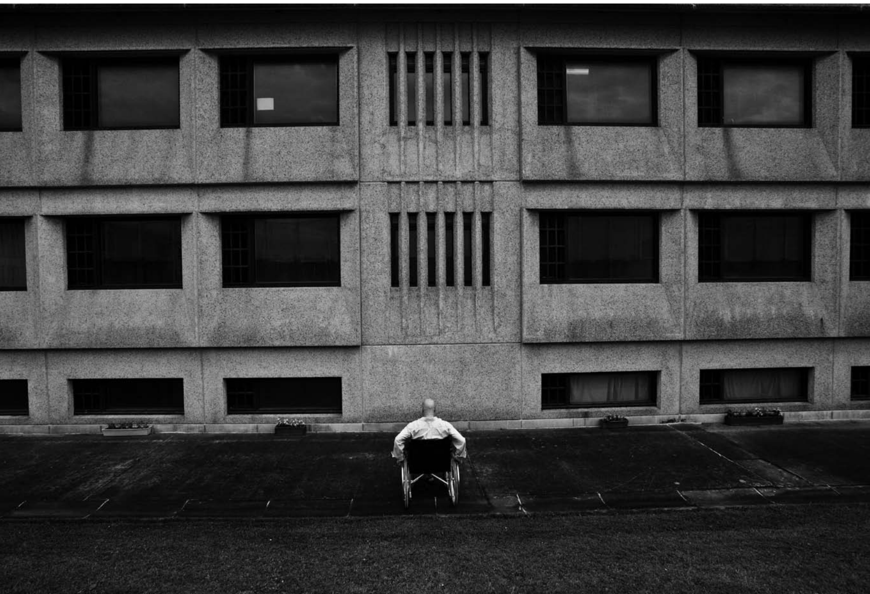
Un détenu dans le bas de la cour de la prison de Paifve (Liège), 12 juillet 2011